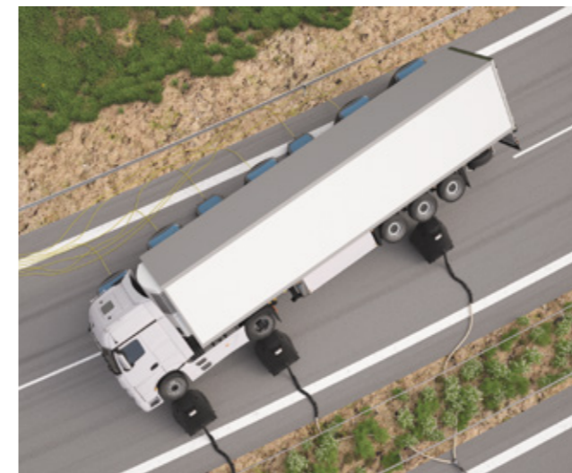
Schnelle, sichere und materialschonende Bergung

Besuchen Sie unsere Website unter vetter.de und schauen Sie sich unser Anwendungsvideo an! Sie werden sehen: So geht wirklich durchdachte LKW-Bergung! Haben Sie Interesse? Dann melden Sie sich gleich unter +49 (0) 22 52 / 30 08-660 oder vetter.info@idexcorp.com ! Wir beraten Sie gerne!